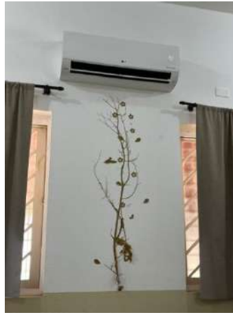
AR 12btus – NOS (Solo)