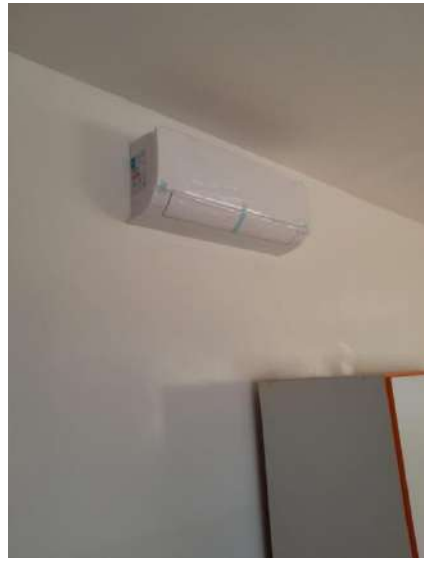
AR CONDICIONADO - ALVORADA

Os materiais vão melhorar o atendimento de aproximadamente 230 crianças nos três contraturnos Cáritas.