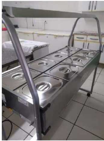
Carrinho Buffet – Paec