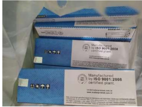
ITENS DE PAPELARIA - NOS