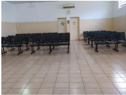
Longarinas 4 lug – Paec