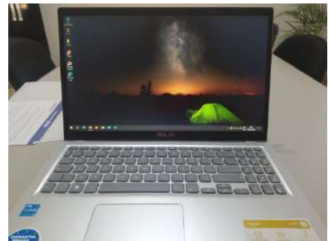
Notebook – Paec