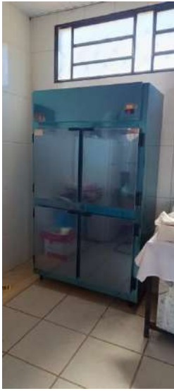
GELADEIRA - ALVORADA