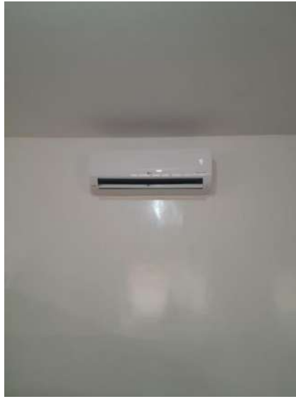
AR CONDICIONADO - ALVORADA