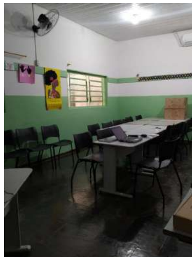
Longarinas – sala 03 Paec