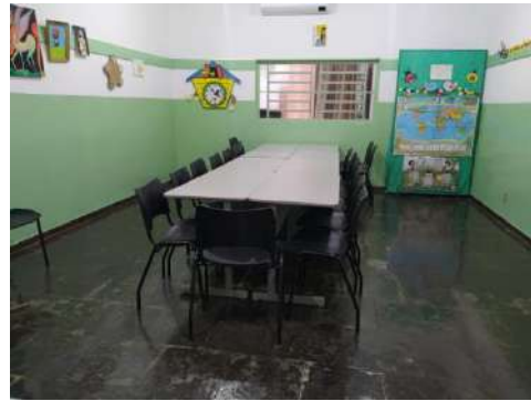
Longarinas – sala 01 Paec