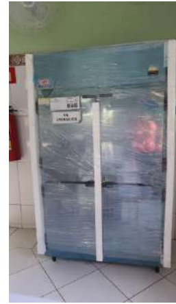
Geladeira - Paec