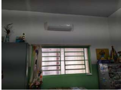
01 ar de 12btus – Sala Coord. Paec