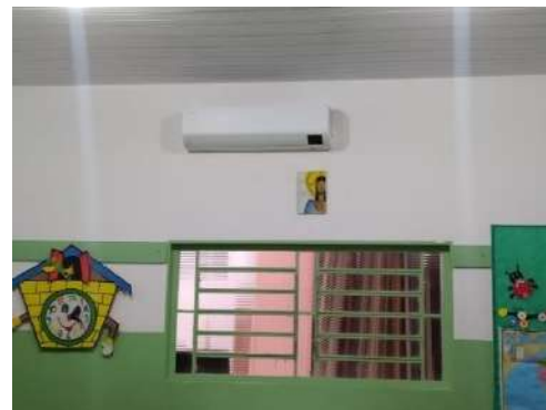
01 ar de 22btus – Sala 01 Paec