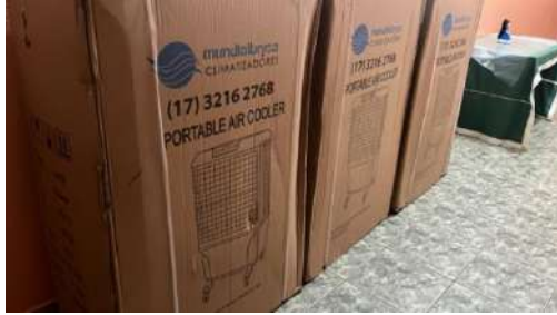
Climarizadores – NOS/ALVORADA