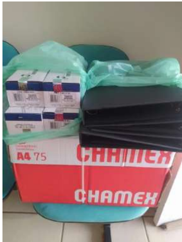
ITENS DE PAPELARIA - NOS