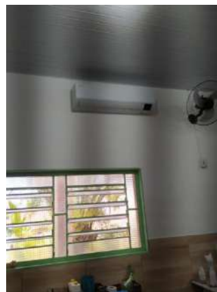
01 ar de 22btus – Sala 04 Paec