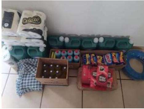
Itens consumo – limpeza NOS