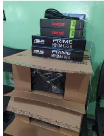
02 CPU – Paec